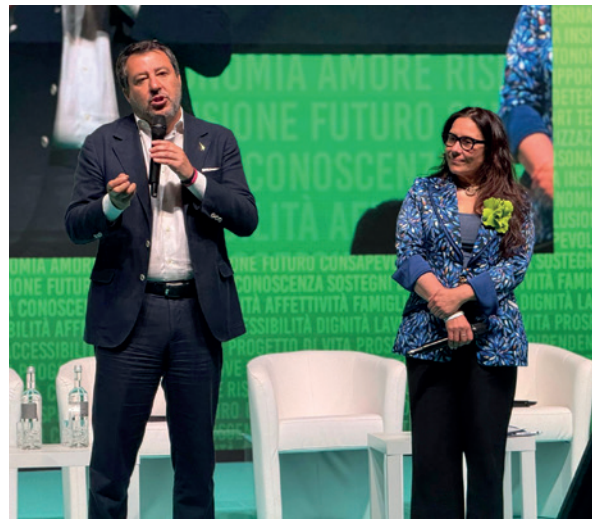
Il vicepresidente del Consiglio Matteo Salvini e il ministro Alessandra Locatelli

Oltre alla parte convegnistica, a Italia Insieme è stata allestita un'area espositiva con gli stand delle Regioni, del terzo settore e an-