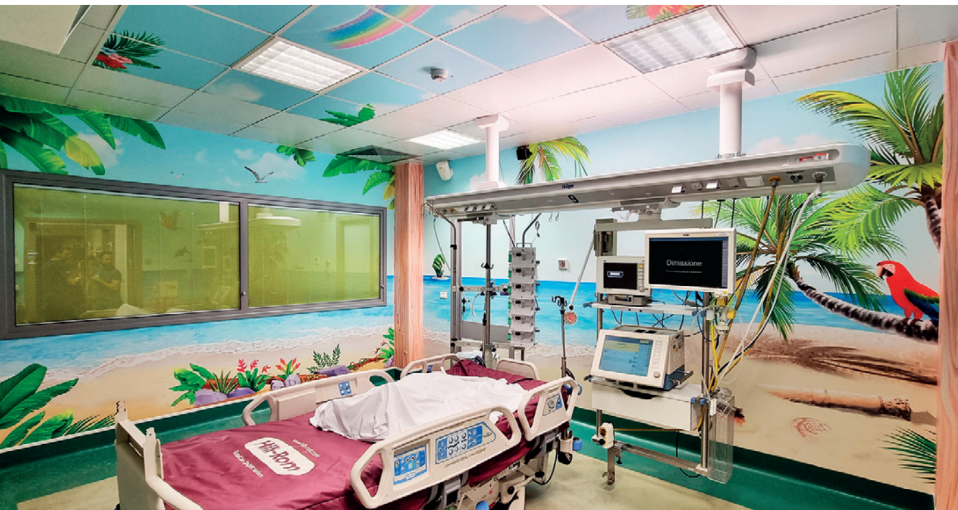
Il reparto di terapia intensiva a Pescara, una delle grandi conquiste del Progetto Noemi