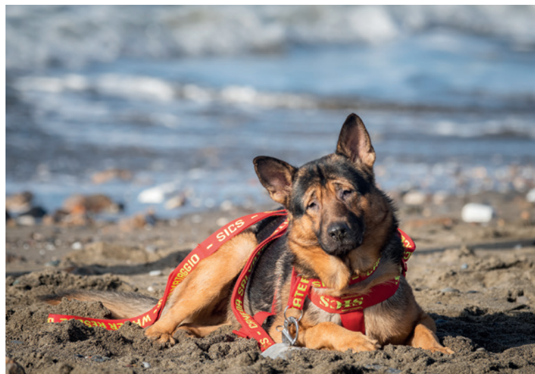
Marley al mare