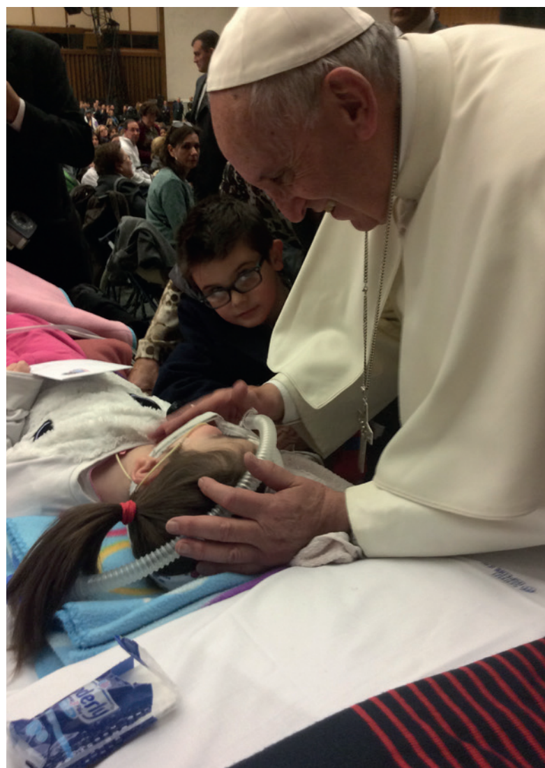
Noemi durante l'incontro con Papa Francesco

Così nell'aprile del 2013 nella loro Guardia-grele, in provincia di Chieti, in Abruzzo, nasce