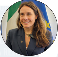
di Alessandra Locatelli Ministro per le Disabilità