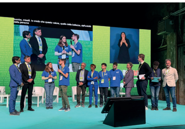
La presentazione della Rete Bilt (Bellezza, inclusione, lavoro, talenti), promossa dal ministro Locatelli

La seconda sessione, incentrata su Tempo libero per tutti, attività sportive e ricreative nel turismo esperienziale , ha approfondito invece il ruolo dello sport e delle esperienze come leve fondamentali per un turismo accessibile. Interventi da parte di assessori regionali, esperti di welfare, operatori del turismo e rappresentanti del mondo dell'associazionismo hanno evidenziato come l'inclusione passi anche dalla possibilità di vivere appieno il tempo libero. Nel pomeriggio il terzo panel Inclusione lavorativa nel turismo, opportunità e buone pratiche ha acceso i riflettori sull'accesso al lavoro per le persone con disabilità. Poi è stata la volta della testimonianza della rete Bilt (Bellezza, inclusione, lavoro, talenti) che ha ribadito il valore della formazione e delle com-