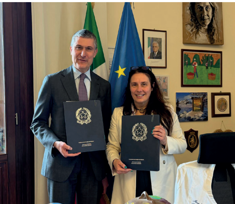
Il presidente del Consiglio Nazionale del Notariato Vito Pace e il ministro per le Disabilità Alessandra Locatelli

Il protocollo prevede, in particolare, una serie di azioni condivise: attività di informazione e divulgazione, attraverso campagne, convegni e tavole rotonde, per diffondere le opportunità e i vantaggi degli strumenti giuridici a supporto delle persone con disabilità e delle loro famiglie; percorsi formativi sul territorio, rivolti a professionisti, famiglie, associazioni ed enti del terzo settore, per accrescere competenze, favorire lo scambio di esperienze e sviluppare reti collaborative; promozione di strumenti operativi innovativi, con particolare riferimento alla valutazione multidimensionale e alla definizione dei progetti di vita; monitoraggio dell'applicazione della normativa vigente, con attenzione alle misure di vantaggio economico-fiscale e agli strumenti di protezione e pianificazione patrimoniale; supporto tecnico-scientifico all'Osservatorio nazionale sulla condizione delle persone con disabilità; partecipazione a programmi e progetti del Dipartimento, anche attraverso il coinvolgimento di esperti del Notariato e collaborazione per interventi a favore del terzo settore, con l'obiettivo di rafforzare le iniziative dedicate all'inclusione e al sostegno delle persone con disabilità. ■