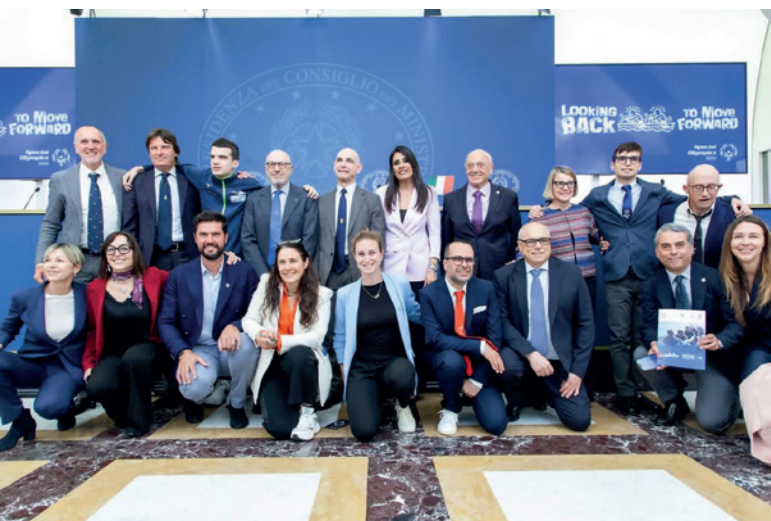
Un momento della conferenza stampa di presentazione del primo Meeting internazionale di canottaggio Special Olympics

Particolarmente significativo è stato il momento dell'Unified Experience, in cui equipaggi misti composti da atleti con e senza disabilità intellettive, partner e rappresentanti istituzionali hanno remato insieme, offrendo un'immagine concreta di cosa significhi inclusione. Grande attenzione è stata dedicata anche alla formazione, con il percorso Coach for inclusion , che ha coinvolto tecnici italiani e internazionali. In questo contesto, Special Olympics Italia si è confermata realtà pioniera nello sviluppo del canottaggio, con l'obiettivo di promuoverne la diffusione a livello internazionale e favorirne l'inserimento tra le discipline ufficiali dei Giochi Mondiali Estivi Special Olympics. Alla fine, ciò che resta non sono solo i risultati o le classifiche. Restano le relazioni costruite, la fiducia conquistata, la consapevolezza di far parte di qualcosa di più grande. Il canottaggio insegna che si va avanti solo insieme. Ed è proprio questo il messaggio che il progetto vuole lasciare: dentro e fuori dall'acqua, nessuno è escluso. ■