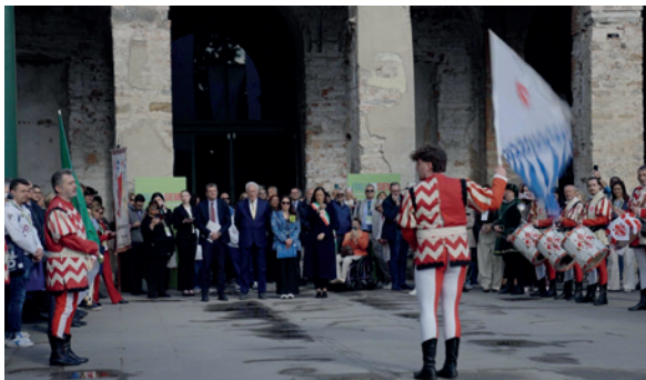
L'esibizione degli Sbandieratori dei Borghi e Sestrieri fiorentini in apertura dell'evento Italia Insieme

che 12 food truck. L'evento è stato preceduto da una cena di gala curata da 25 associazioni che fanno inclusione lavorativa in collaborazione con il dipartimento Solidarietà ed emergenze della Federazione italiana cuochi. La cena è stata interamente preparata e servita dai ragazzi con disabilità delle diverse associazioni, con l'intrattenimento musicale della Rangers Music Band dell'associazione Il Brugo di Brugherio . ■