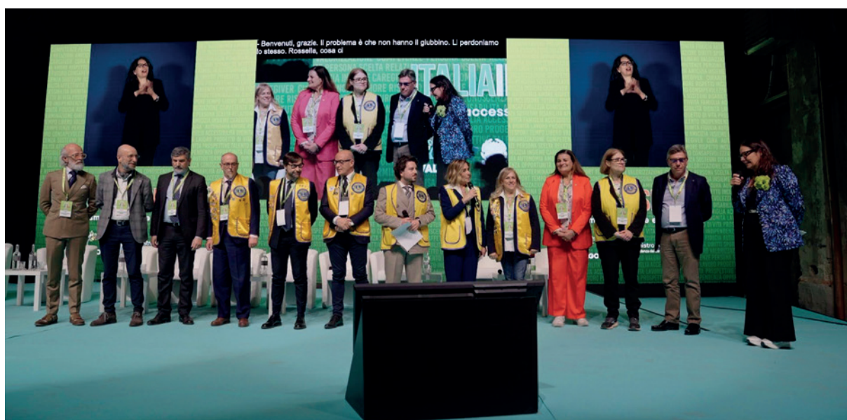
I Lions all'evento Italia Insieme raccontano i loro progetti

sive. La giornata si è conclusa con una tavola rotonda dedicata allo sviluppo di un sistema territoriale inclusivo. Un momento di sintesi che ha coinvolto rappresentanti delle istituzioni e del settore dei trasporti e del turismo, evidenziando la necessità di un approccio integrato tra mobilità, accoglienza e servizi. Il ministro Locatelli ha poi firmato un protocollo con Cittàslow Italia per la promozione e la