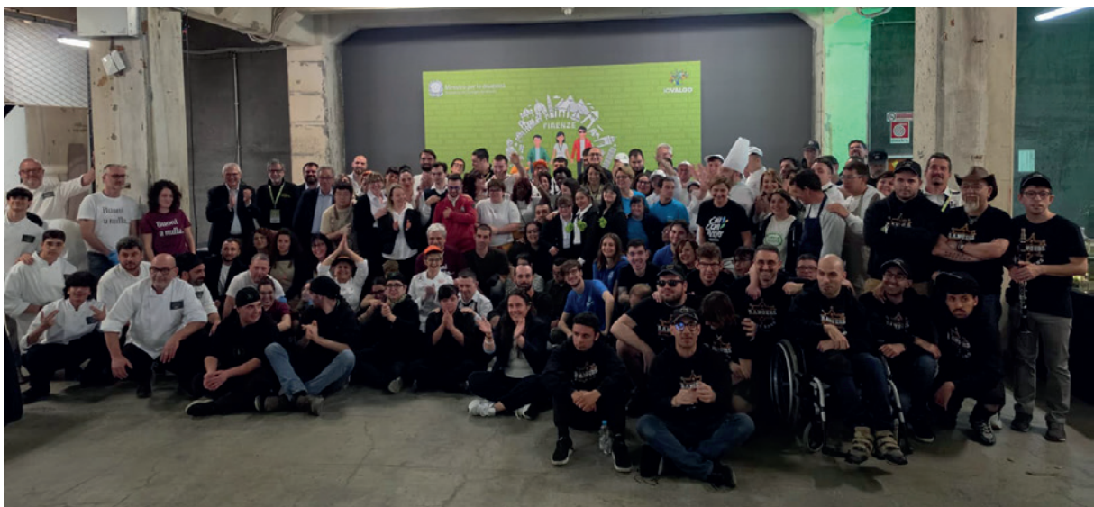
Le 25 associazioni che hanno curato insieme alla Federazione italiana cuochi la cena di gala del 21 aprile che ha preceduto l'iniziativa Italia Insieme

che 12 food truck. L'evento è stato preceduto da una cena di gala curata da 25 associazioni che fanno inclusione lavorativa in collaborazione con il dipartimento Solidarietà ed emergenze della Federazione italiana cuochi. La cena è stata interamente preparata e servita dai ragazzi con disabilità delle diverse associazioni, con l'intrattenimento musicale della Rangers Music Band dell'associazione Il Brugo di Brugherio . ■