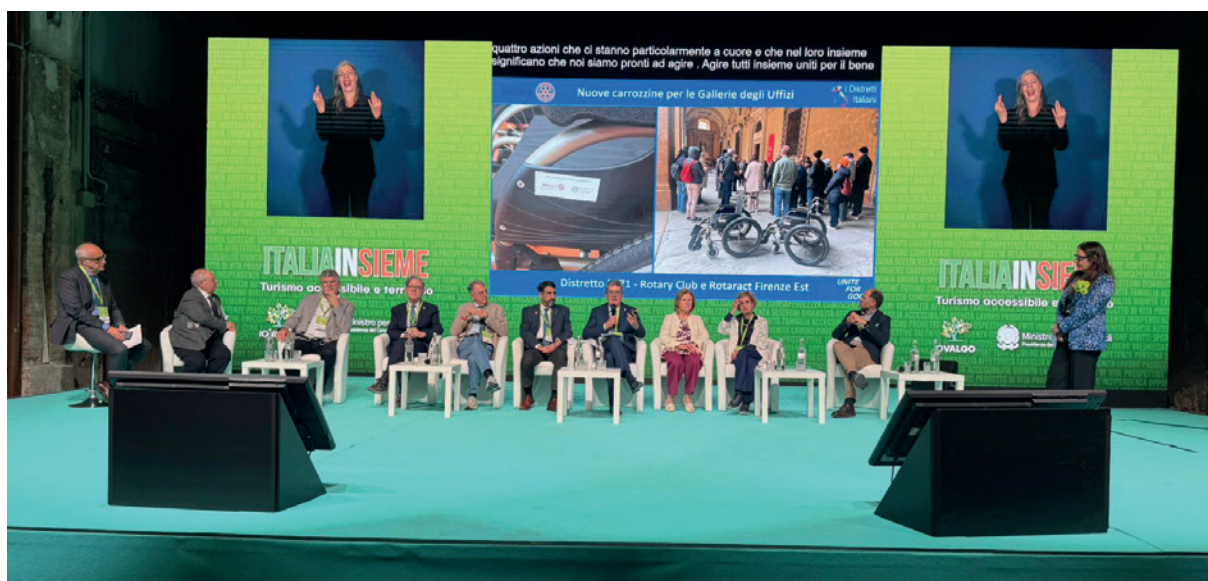
La testimonianza dei Rotary a Italia Insieme

petenze come strumenti fondamentali per favorire l'inserimento professionale. Il quarto panel, dedicato ai Servizi per un turismo realmente accessibile , ha affrontato il tema delle infrastrutture e dell'organizzazione dell'offerta turistica. Spazio anche al contributo del volontariato con la testimonianza di Lions e Rotary, a sottolineare il ruolo delle reti associative nella costruzione di comunità più inclu-