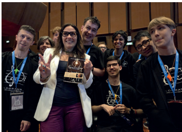
Il ministro Locatelli con Ologramma Band, vincitori nella sezione musica